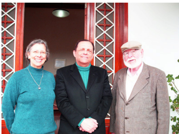
Reitor da USP e Diretores do Museu