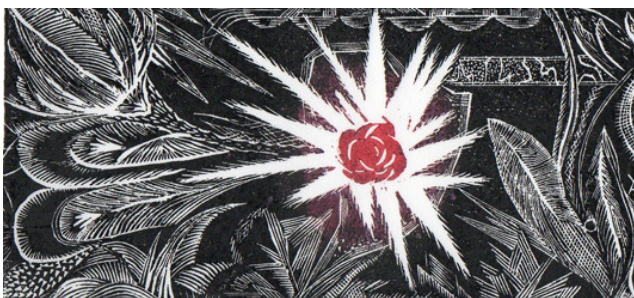
Xilogravura de Gino Savino

A partir de 12 de outubro de 2013 a Casa da Xilogravura exporá xilogravuras do artista Gino Savino.