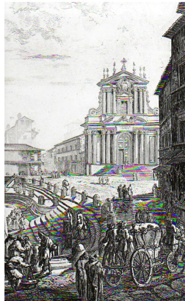
Detalhes de gravuras de Della Bella e Piranesi expostas na Casa da Xilogravura