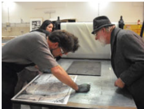
Impressor da Calcografia Nazionale, Roma, confere o resultado da impressão, que acaba de realizar com o uso de um antigo prelo manual.