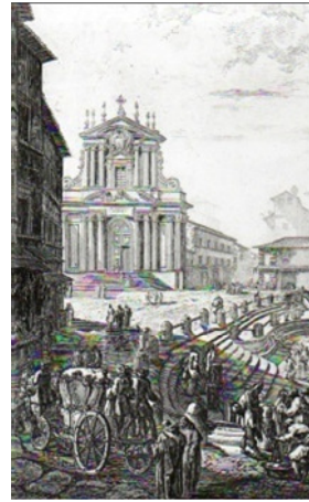
Detalhes de gravuras de Della Bella e Piranesi expostas na Casa da Xilogravura