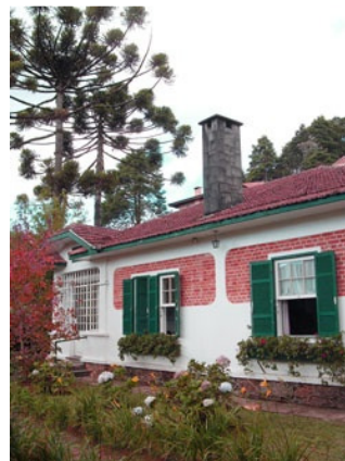
Fotos: Segall e casa do artista, em Campos do Jordão